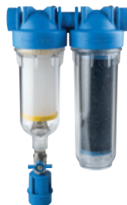
-RAINMASTER DUO- doppio stadio RSH+LA