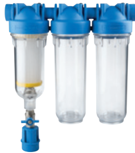
-TRIO RSH- triplo stadio