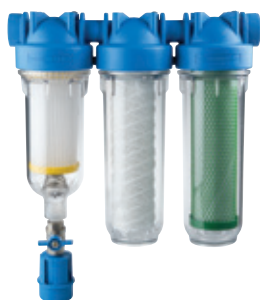
-RAINMASTER TRIO- triplo stadio RSH+FA+CB EC