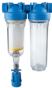
-DUO RSH- doppio stadio