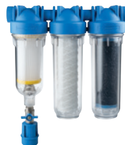
-RAINMASTER TRIO- triplo stadio RSH+FA+LA