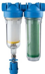
-RAINMASTER DUO- doppio stadio RSH+CB EC